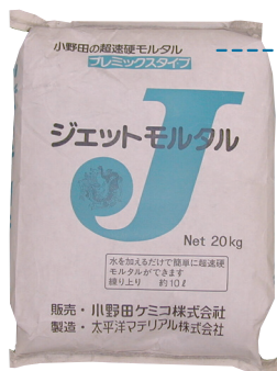
● ジェットモルタル 20kg/袋