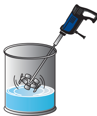
② ハンドミキサーで練り混ぜ