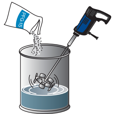
③ PFG-15を投入して練り混ぜ3分