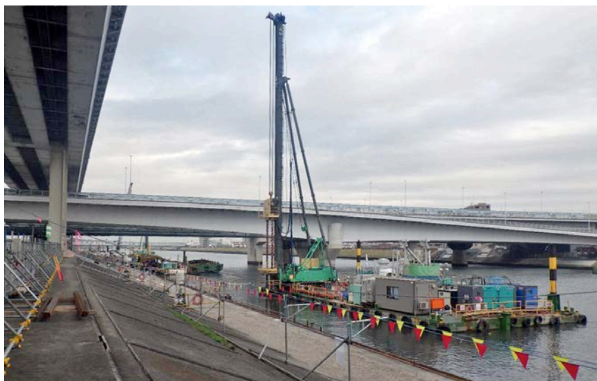
地盤改良(WHJ工法)施工状況