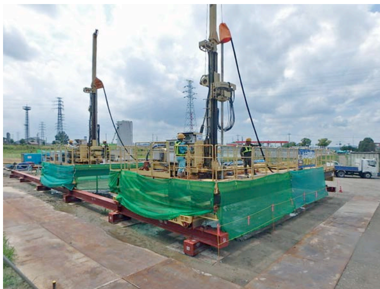
地盤改良(LDis-Dy 工法)施工状況